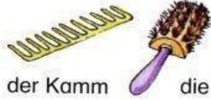
der Kamm die Bürste