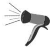
der Föhn/ Haartrockner